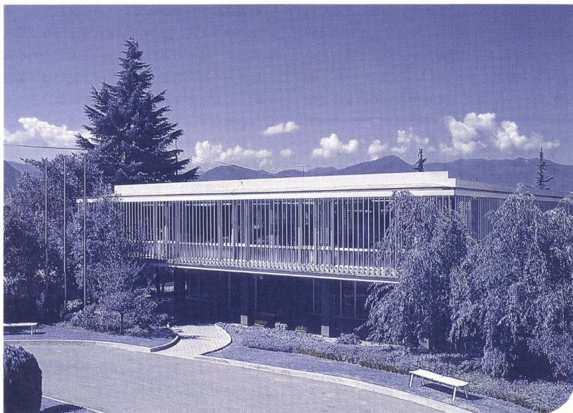
5月新装開館の附属図書館